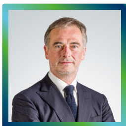
Едоардо Гароне Председател

Актуализирането на Етичния кодекс е резултат от задълбочен вътрешен процес на размисъл и диалог относно идентичността на нашата компания, нейната мисия и принципите, които решително защитаваме. Тези основни стълбове включват ангажимент за етична и социална корпоративна отговорност, опазване на околната среда, насърчаване на равенството и справедливостта, честност, почтеност, зачитане на правата на човека и насърчаване на равните възможности във всеки аспект от нашата дейност. Освен това потвърждаваме отново ангажимента си да се противопоставяме на всички форми на дискриминация и корупция. Тази отговорност се споделя и прилага на практика всеки ден от всички служители на ERG, които са посланици на ценностите на Групата, чийто пазител и водач е Етичният кодекс.