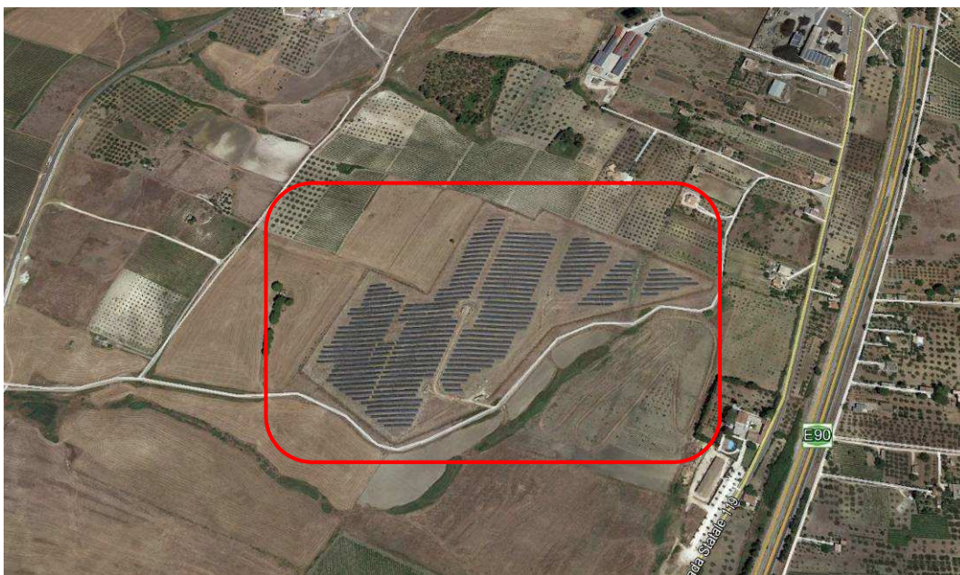
Fig.1:Inquadramento impianto FV