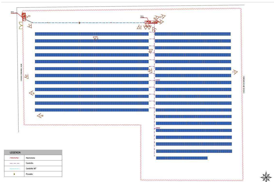
Figura 2: Planimetria aerea