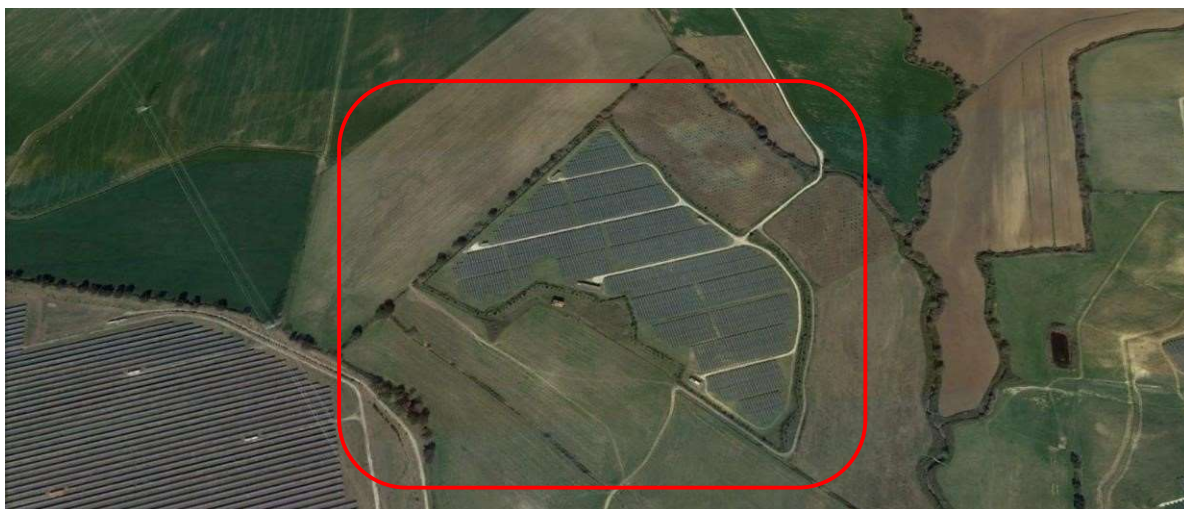
Figura 1: Inquadramento impianto FV