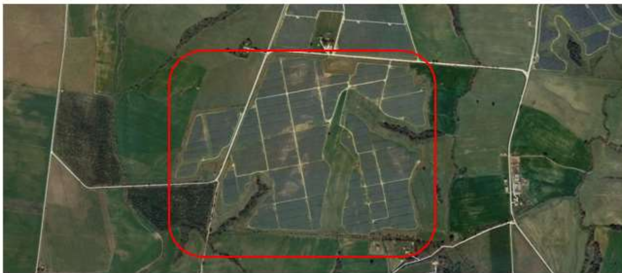
Figura 1: Inquadramento impianto FV