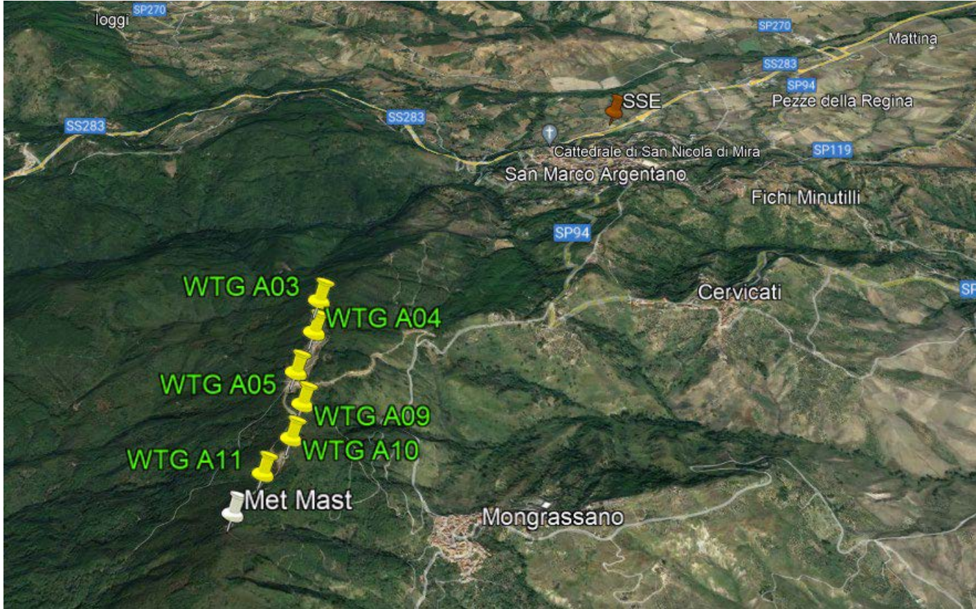
Figura 1 - Parco Eolico "Aria del vento".

Il parco eolico si sviluppa in un territorio prettamente agricolo, la cui morfologia risulta distinta da uno sviluppo pianeggiante-collinare.