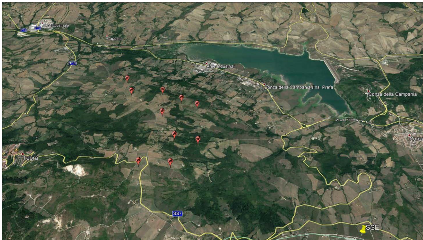
Figura 1 - Parco Eolico "Conza".

Il parco eolico si sviluppa in un territorio prettamente agricolo, la cui morfologia risulta distinta da uno sviluppo collinare.